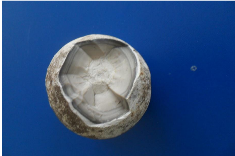
Песчинка, которой 286 млн. лет