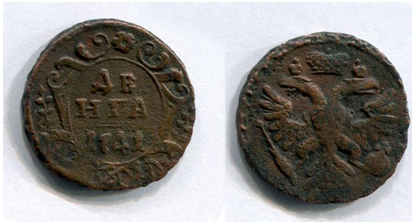
Самая ранняя монета-«Деньга», найденная в окрестностях села датируется 1741 годом.