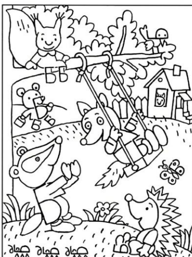
Найди пятнадцать букв Б, спрятанных в этой картинке.