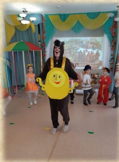
Фото 4 «Применение метода видеотерапии»

Высокая мотивационной включенности в процесс социореабилитации детей с ТНР и членов их ближайшего окружения опирается на некоторые психологические механизмы формирования мотивационной включенности в логопсихотерапевтический процесс: «механизм адекватности» - механизм адекватного отношения к дефекту (недостаткам), «механизм формирования стремления к «идеальному Я». Здесь можно предложить ребенку и родителям оформить портфолио, где дети будут собирать свои достижения, будут видеть свои успехи. Можно предложить оформить такие страницы как «Мой трудный звук Р», приложить сочиненные сказки или выученные стихотворения (фото5,6).