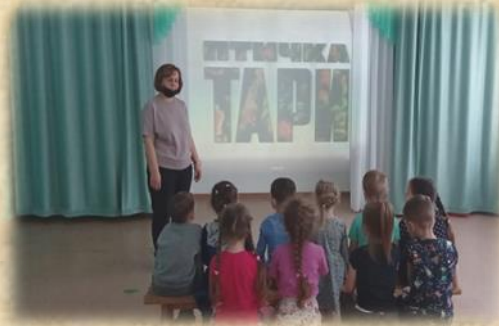
Фото 3 «Просмотр мультимедийного фильма «Птичка Тари»

Кинотерапия – это использование терапевтического потенциала специально подобранных фильмов и активное использование видеосъемки в работе с детьми на разных этапах (фото 3).