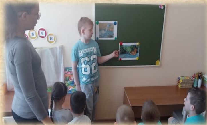
Фото1. «Рассматривание иллюстраций к сказке Г.-Х. Андерсена»

Библиотерапия применяется с учетом данных, которые предоставляет психолог. Для выявления внутрисемейных отношений и мотивации к общению можно использовали данные тестов, проведенных психологом на потребность ребенка в общении и на оценку его мотивации.