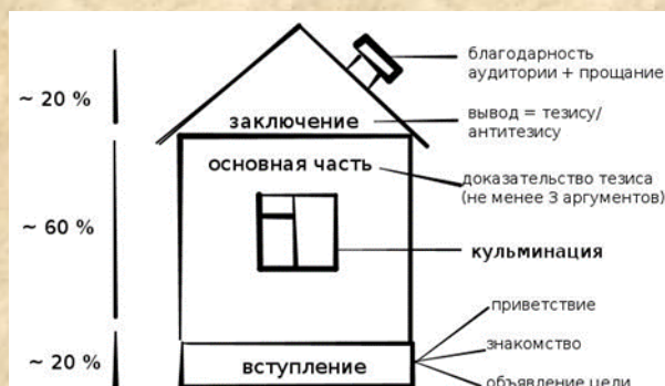
Рис. 1 Композиция

5. Отсутствие слов-паразитов, так как они не несут полезной информации, часто повторяются без надобности, поэтому засоряют речь – э, вот, ну, понимаешь, так сказать, как бы и др.