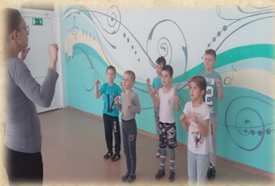
Фото 2 «Дыхательные упражнения»