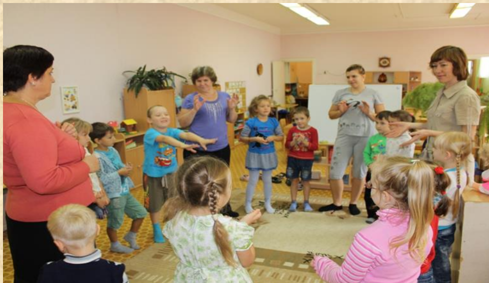
Рисунок 1 «Упражнение «Речевой волейбол»

Подготовительный этап включал в себя 8 практических занятий в течение одного месяца (октябрь) с участием родителей, в ходе которых происходило обучение дыхательной гимнастике, основным речевым играм и упражнениям. На рисунке 1 представлено психологическое занятие с элементами СГЛПТ с участием родителей.